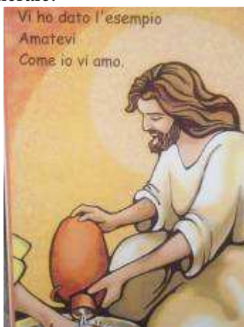
Dipinto di sr. M. Lucia Ghezzi, AdGB

In questo numero abbiamo la gioia di annunciare l'elezione del nuovo Preposito Generale della Compagnia di Gesù, avvenuta il 19 gennaio a Roma in occasione della 35° Congregazione Generale.