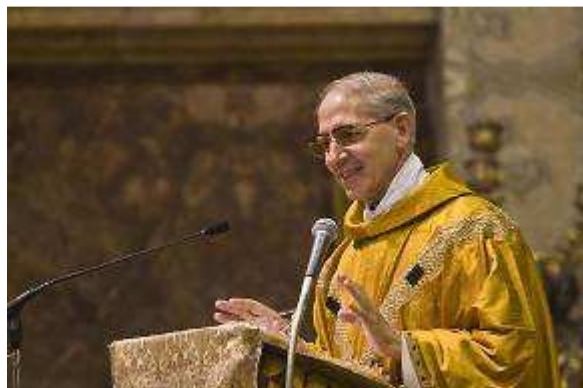
Padre Adolfo Nicolàs s.i., nuovo Preposito Generale della Compagnia di Gesù

Omelia del P. Generale Adolfo Nicolàs SJ, Chiesa del Gesù, domenica 20 gennaio 2008, Santa Messa di ringraziamento.