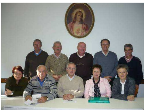
Foto di gruppo di alcuni Amici del Verde con le loro mogli ...